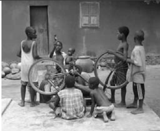
Formation à destination sur l'entretien et la réparation des vélos.

C'est dans le cadre de la Semaine québécoise de réduction des déchets que votre Comité consultatif sur l'environnement s'associe encore cette année à ceux de Ste-Agathe et de Ste-Lucie pour une collecte de vélos usagés avec l'organisme Vélo Nord-Sud.