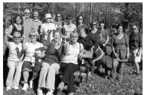
Les marcheurs 2007

Soyez de la partie, le 10 octobre prochain! Dès midi, rendez-vous à la gare de Val-David. Tous ensemble, nous ferons la demi-heure de marche quotidienne recommandée par toutes les instances du milieu de la santé.