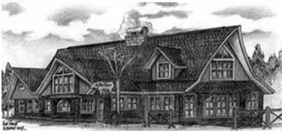
Dessin : Sonia Paquin

Dans l'esprit du thème Contes et légendes de nos villages de la Fête nationale de cette année, j'aimerais vous en livrer, à ma façon, la version valdavidoise.